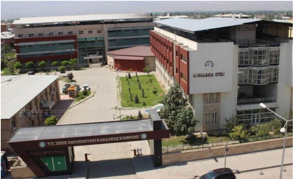
(Şekil 1): Iğdır Üniversitesi Karaağaç Kampüsü